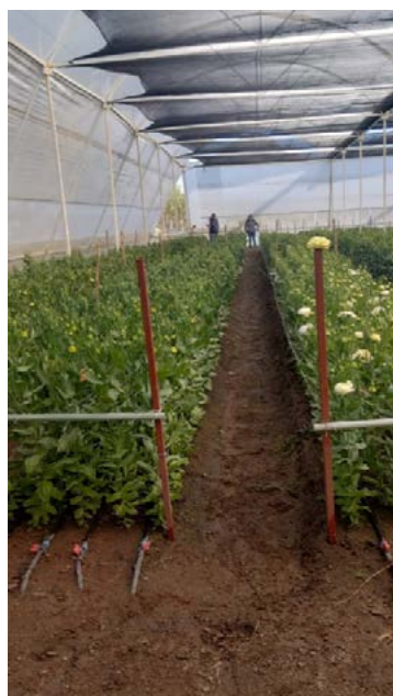
Figura 2. Transferencia de resultados el efecto de bioestimulantes en el cultivo de flores a pequeños productores en comunidades rurales del Estado de México.

La floricultura en Texcoco es una actividad agrícola tradicional bien arraigada y económicamente significativa, especialmente enfocada en especies ornamentales, con mercados locales y regionales importantes. Aunque enfrenta retos de tecnificación y competitividad, posee potencial de crecimiento si se fortalecen las prácticas de producción y comercialización. Por lo anterior, los resultados obtenidos de las investigaciones en las diferentes ornamentales y con los diversos bioestimulantes inorgánicos, constituyen información relevante y nueva que a través de un Manual del uso de Bioestimulantes en Ornamentales estará disponible para los productores de la zona, como parte de una tecnología innovadora que les permita tener acceso a dicha información para poder emplearla en sus sistemas de producción con la finalidad de mejorar la calidad de las ornamentales, favoreciendo su precio de venta. Además, se tiene la disponibilidad para poder hacer la transferencia de la tecnología a través de pláticas con los diferentes grupos de productores de las comunidades productoras de ornamentales del municipio de Texcoco. La producción está concentrada en varias localidades de Texcoco, como Nativitas y Tequexquihuac, con muchos productores organizados en pequeños sistemas productivos tradicionales (Figura 2).