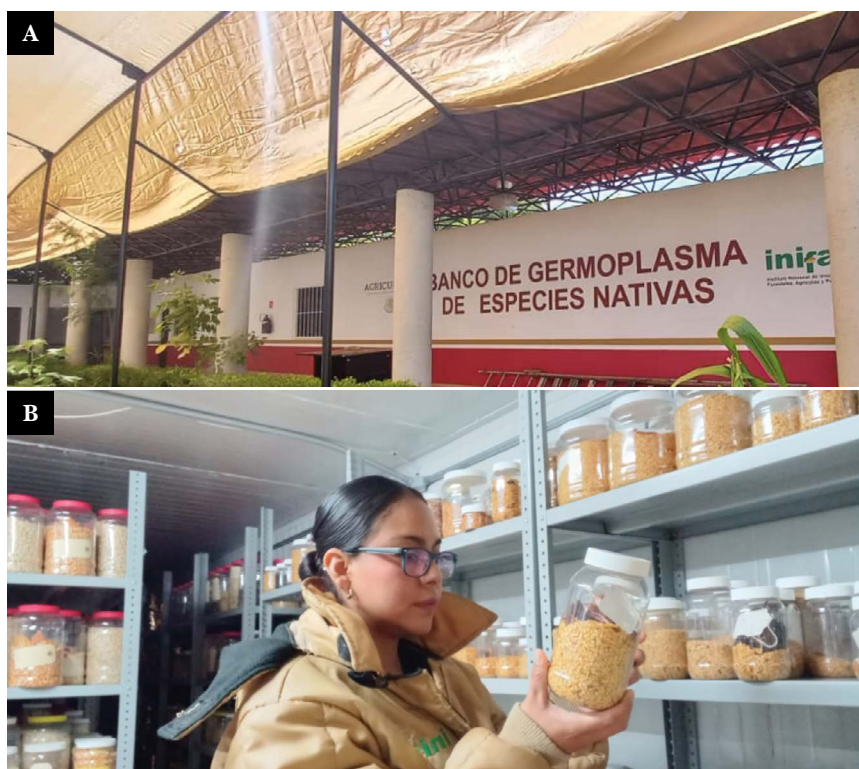
Figura 2. Conservación de accesiones de Chile en el Banco de Germoplasma del Sur. A: exterior del Banco de germoplasma; B: Accesiones de Chile resguardadas en el Banco de germoplasma.

Conservarlas únicamente en el banco de germoplasma no es suficiente, es necesario su utilización, ya que los recursos genéticos se mantienen vivos cuando se siembran en campo. Para lo anterior, se realiza mejoramiento genético participativo con los productores como estrategia de conservación in situ . En el INIFAP de valles centrales se ha integrado