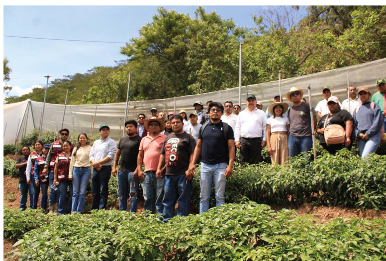
Figura 3. Parcela demostrativa de Chile aplicando mejoramiento genético participativo.

un equipo multidisciplinario (2024) con integración de productores de Chile Huacle y Chile de Agua, con el enfoque de contribuir a la conservación de la biodiversidad en Chile, y reconocer el papel central de los productores (Figura 3), como patrimonio biocultural de Oaxaca.