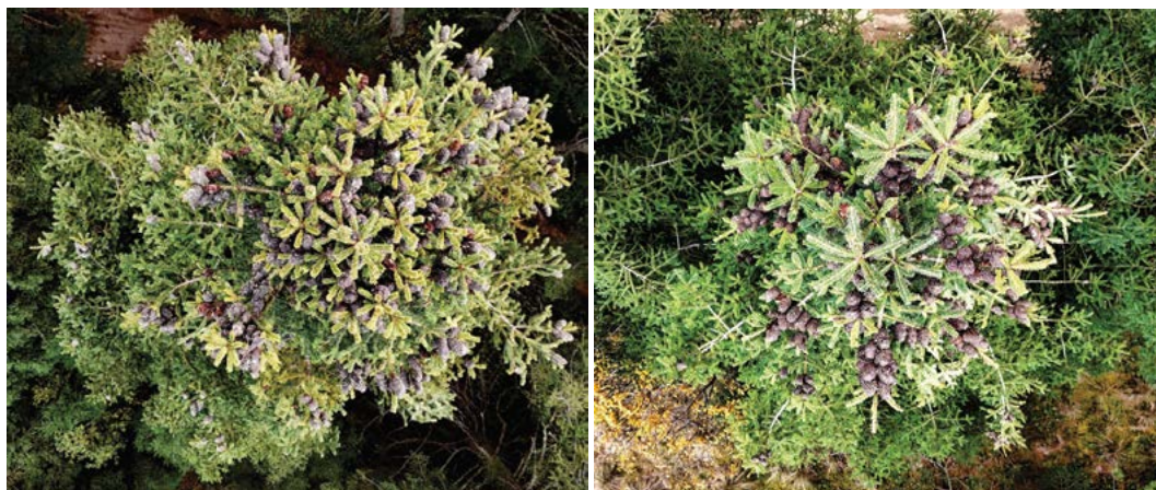
Figura 1. Fotogramas tomados de las copas de árboles con acercamientos para mejorar la visibilidad de los conos producidos y facilitar su conteo.

Se hicieron 134 vuelos, durante los meses de producción de conos de oyamel, de noviembre de 2023 a abril de 2024. Se tomaron 3,113 fotogramas en 33 horas de vuelo y 28.9 km recorridos. El número de árboles fotografiados en los tres niveles altitudinales fue de 225, de los cuales 56 (24.56%) correspondieron al nivel altitudinal superior, 108 (47.37%) al intermedio y 64 (28.07%) al inferior. Se contabilizaron 35,275 conos producidos en los 225 árboles reproductivos; 8,020 (22.74%) conos se produjeron en el nivel superior, 20,179 (57.20%) en el intermedio y 7,076 (20.06%) en el inferior. El total de conos por nivel altitudinal fue diferente entre los tres niveles altitudinales (Kruskal-Wallis: \chi^2=7.185 , P=0.027 , g.l.=2). Sin embargo, se detectaron diferencias significativas solo entre los niveles altitudinales intermedio e inferior ( P=0.009 ), pero no entre el intermedio y el superior ( P=0.134 )