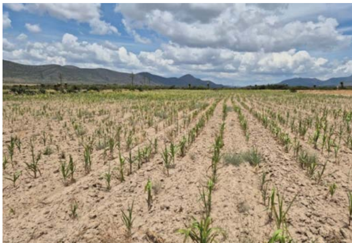
Figura 1. Efecto de la sequía sobre el crecimiento y desarrollo de la planta de maíz nativo bajo condiciones de temporal en el Ejido Guadalupe Victoria, Saltillo, Coahuila.

Esta obra está bajo una licencia de Creative Commons Attribution-Non-Commercial 4.0 International