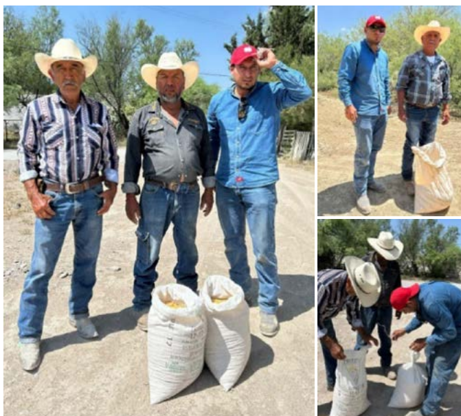
Figura 2. Productores seleccionados por su experiencia en la producción de maíz para el incremento de semilla bajo condiciones de temporal en los ejidos San Juan del Retiro y San Francisco del Ejido.

grano amarillo derivada de dos poblaciones de la raza Ratón obtenida de un ciclo de selección recurrente de familias de hermanos completos para establecer una hectárea para el incremento de la semilla (Figura 2). En una segunda estrategia para la reproducción de semilla de maíz nativo y en colaboración con el comisariado Ejidal de Guadalupe Victoria, se estableció una hectárea bajo condiciones de riego con dos poblaciones; el modelo de producción consiste en proveer las condiciones agronómicas adecuadas para la producción de semilla y a su vez mínimas en la disponibilidad hídrica, que permitan conservar su adaptación a las condiciones de producción regionales. La producción de semilla en condiciones de riego puede ser replicable en lotes de producción comercial bajo riego, que podría abastecer a los productores regionales con semilla de maíz nativo, de ser así, la venta de semilla es más rentable que la comercialización del grano coadyuvando la conservación de maíces nativos.