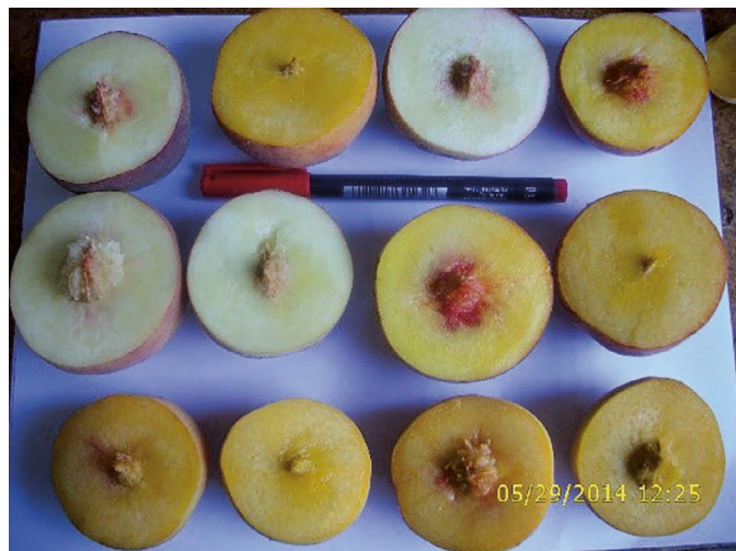
Figura 2. Características visuales de frutos de durazno de las variedades sobresalientes.